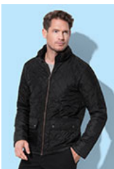
ST5260 Quilted Jacket