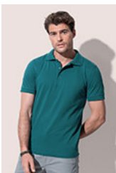
ST9060 Harper Polo