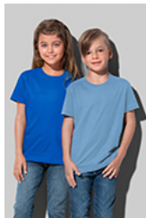
ST2200 Classic-T Kids

Dane wymiarowe podlegają standardowym tolerancjom i służą jedynie ogólnej orientacji (± 2,5 cm).