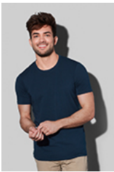
ST9600 Clive Crew Neck