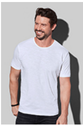
ST9400 Shawn Slub Crew Neck